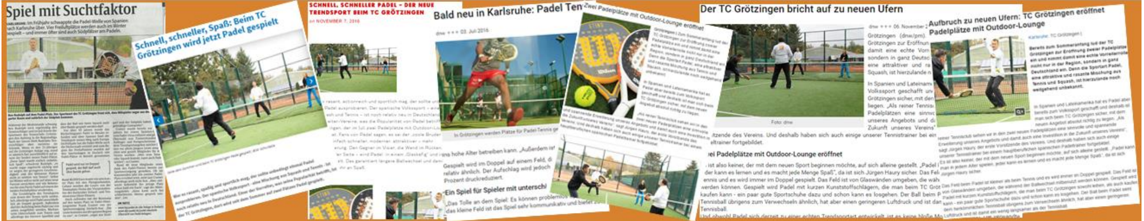
Padel beim TPC Grötzingen